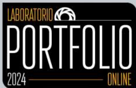
PHOTO PORTFOLIO FIRENZE on-line